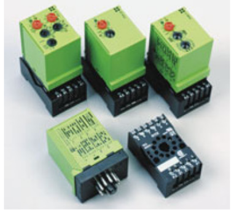
16 fonctions, 16 temporisations et 2 inverseurs est disponible.

Avec la série de relais temporisés „PULS“, nous proposons une série complète de relais temporisés enfichables pour socles à 11 pôles. En ce qui concerne les fonctions, Tele est en mesure de proposer tout ce que le marché demande. Cette gamme comprend également des types pour montage en étoile-triangle ou avec un et deux télé-potentiomètres, ou encore avec deux contacts inverseurs. De même, un appareil multifonctionnel avec