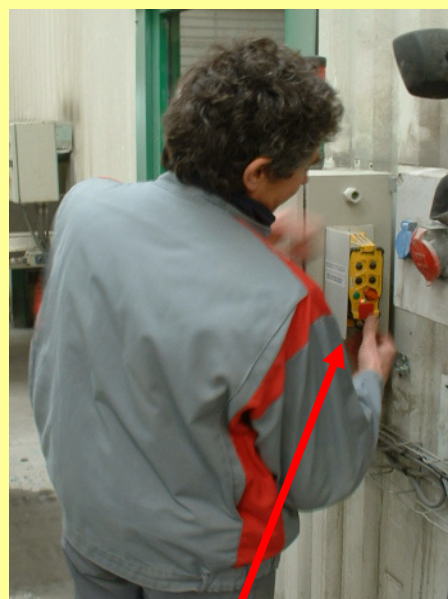
Emetteur sur son support