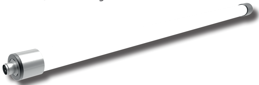
Abgebildete Variante = PS TubeLED 1080