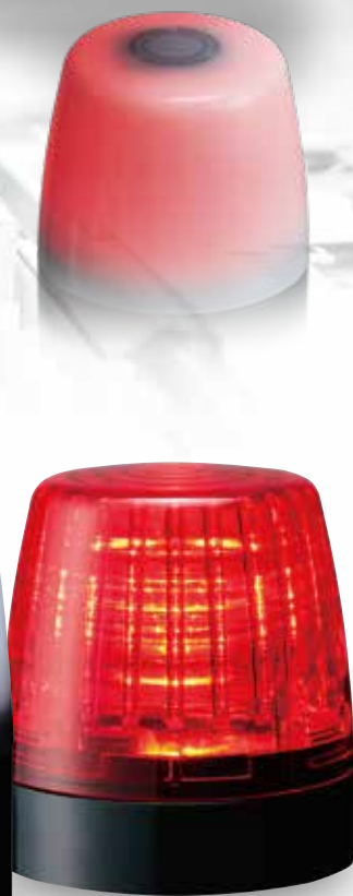
Einfarbiges Modell (Rot)