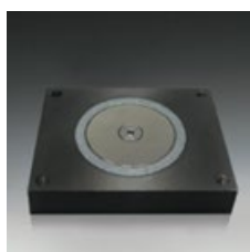
Artikel B02 Magnetbasis Abmessungen 60x60x15mm