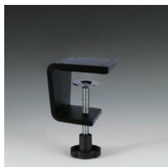
Artikel CLAMP.04 Schraubklemme