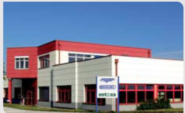
Firmengebäude Schlegel Vertriebs Ges.mbH, Österreich

Aus einem Unternehmen mit anfänglich zwei Mitarbeitern und einem Warenlager von zehn Quadratmetern wuchs SCHLEGEL Österreich rasch zu einem Vertriebsbüro mit 15 Mitarbeitern und einem Sortimentslager von 150 Quadratmetern. Vom Standort Wiener Neustadt beliefert das Unternehmen viele namhafte Industrie- und Handelsfirmen. Darüber hinaus werden von der GEORG SCHLEGEL VERTRIEBS Ges.mbH auch komplette Tastentableaus, konfektionierte Klemmleisten und Tastengehäuse gefertigt. SCHLEGEL Österreich ist verantwortlich für den Vertrieb in folgende Länder: Bosnien-Herzegowina, Kroatien, Mazedonien, Tschechische Republik, Ungarn, Serbien, Slowenien, Rumänien und Bulgarien. In Tschechien und Kroatien wird SCHLEGEL Österreich von Firmen vor Ort mit eigenen Warenlagern vertreten.