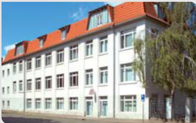
Firmengebäude Schlegel Elektrokontakt GmbH, Leipzig

Seit November 2005 ist DUX nach dem Qualitätsmanagementsystem DIN EN ISO 9001 zertifiziert. Im Jahr 2013 wurde DUX in SCHLEGEL ELEKTROKONTAKT GmbH umbenannt.